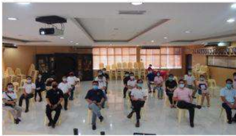
雪隆福青日前成功召开团员大会，并顺利举行第19届理事会改选。

中马 发布于 2020年08月11日 14时33分 · 最后更新 2周前 · 整理: 蔡念樺